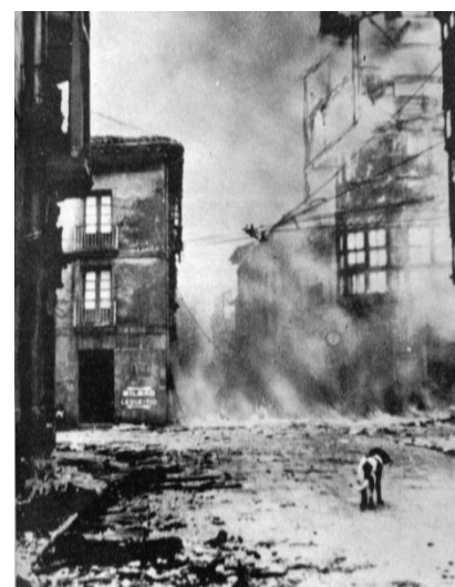
Guernica, vue d'ensemble, après les bombardements.

Artiste utilisant tous les supports pour son travail, il est considéré comme le fondateur du cubisme avec Georges Braque et un compagnon d'art du surréalisme. Il est l'un des plus importants artistes du XX e siècle, tant par ses apports techniques et formels que par ses prises de positions politiques. Il a produit 50 000 œuvres dont environ 8 000 tableaux.